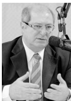
Ministro Bernardo participou de reunião com sindicatos

DEBATE - Com dificuldade de diálogo com o governo, que preparou um projeto que vai causar vários prejuízos aos professores, cabe aos docentes discutir como garantir a retomada de uma negociação de verdade e que tenha espaço para o atendimento das reivindicações da categoria com relação à carreira.