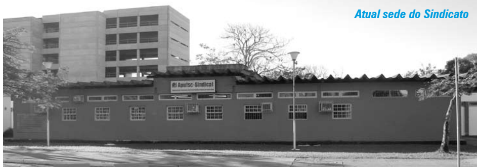
Atual sede do Sindicato

No informe divulgado, a UFSC justifica que o reajuste servirá para zerar as diferenças dos últimos anos causadas pela alta sinistralidade (diferença entre arrecadação e despesa), que ocorreu por fatores como "demanda reprimida; extensão do prazo de adesão sem carência; do fato de não ser levado em conta doenças preexistentes; faixa etária alta tanto de servidores quanto de seus agregados; e, grande número de procedimentos e internações no início do contrato.